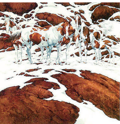
这幅图中,你看见了多少匹马?