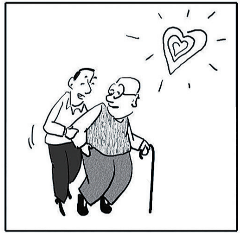
要有光,太阳的光是不够的,还要有心灵的光。