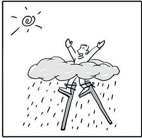
当你快乐时,你要想,快乐不是永恒的;当你痛苦时,你要想,痛苦也不是永恒的。