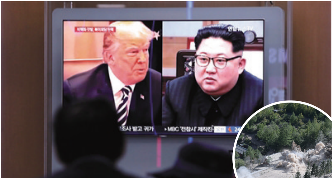
5月24日,韩国民众观看电视相关新闻报道 朝鲜中央通讯社公布的核试验场爆破照片

当天稍早,特朗普当地时间25日通过社交媒体称,很高兴从朝鲜方面收到“热忱而富有成效的声明”。特朗普表示,我们将很快看到朝方声明将把事件进展引向何方,希望能引向长期、持久的繁荣与和平,而只有时间才能证明一切。