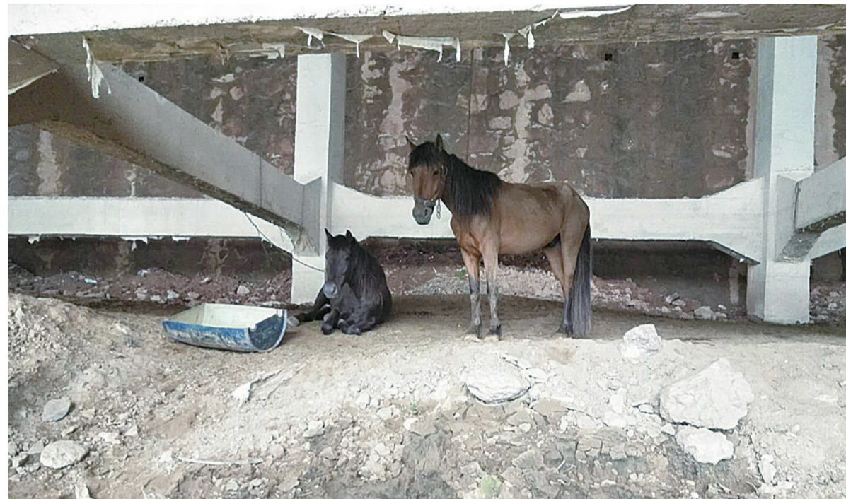
▲刘先生饲养的马匹将转移他处