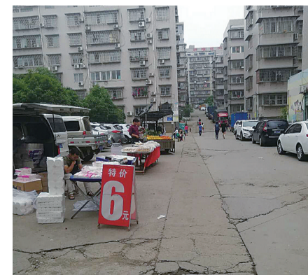
▲仁和小区内的流动摊位

一些居民告诉记者,小区附近有两个菜市场,但要走很远的路,在小区里就能买菜其实能给居民提供方便,“只要不影响交通,我们也没什么意见。”