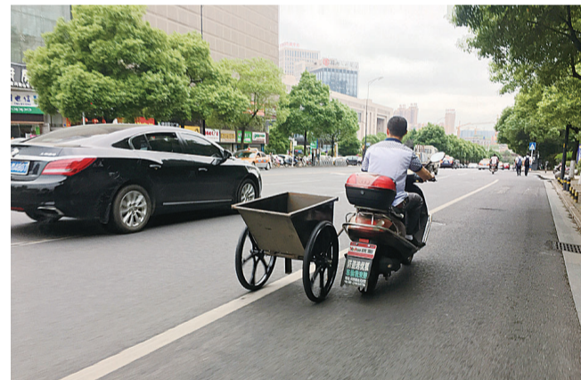
昨日上午,在天元区珠江路上,一名骑电动摩托的男子右手控制把手,左手牵着一辆斗车在道路上快速骑行。由于操控不便,电动摩托多次与路中小车擦肩而过,十分危险。