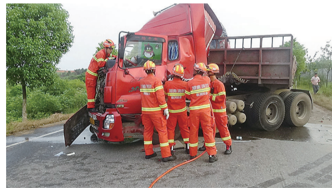
前日早上6时许,攸县菜花坪镇境内发生两货车相撞事故,其中一辆红色货车的车头严重变形,司机头部受伤被困在驾驶室。随后,当地消防部门通过破拆将他救出。由于救援及时,伤者没有生命危险。(记者 刘玺 通讯员 杨洋 摄影报道)