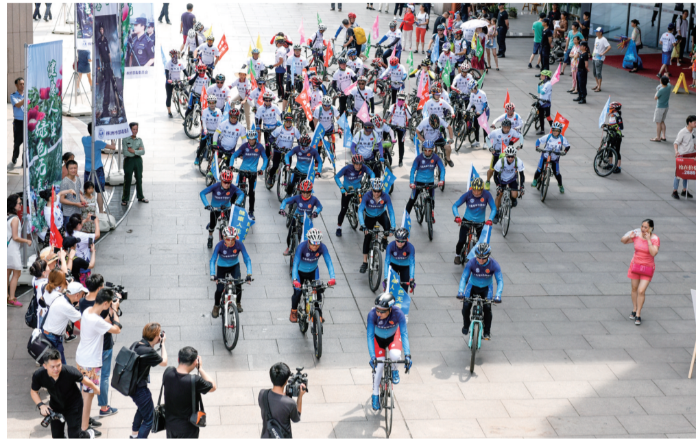
▲骑行队伍开始出发

“别让迷幻的沉醉,吞噬你所有期待;别让罪恶的诱惑,牵着你脚步徘徊……”昨日上午10点,我市禁毒公益歌曲《拥抱阳光》在神农城广场唱响,这标志着以“健康人生·绿色无毒”创建禁毒工作示范市为主题的环株洲千人接力骑行禁毒宣传活动启动。