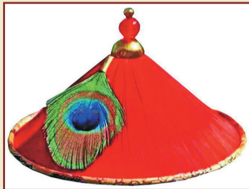
▲清代朝冠上的孔雀花翎