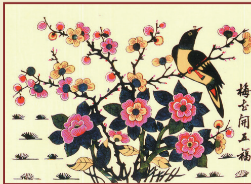
▲清代山东潍坊杨家埠版画《梅花开五福》,梅枝栖一喜鹊,俗称“喜上眉梢”