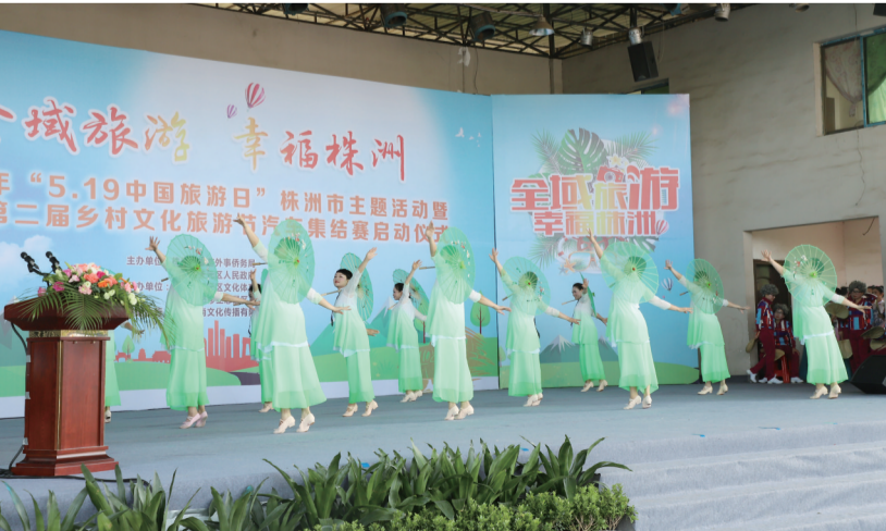
▲活动现场,还进行了精彩的文艺表演

5月19日是“中国旅游日”。当天,我市“全域旅游·幸福株洲”主题活动,在天元区悠移生态景区进行。为迎接旅游日,方特欢乐世界、酒仙湖、白龙洞、炎帝陵、神农谷等景区推出了一系列旅游优惠措施。