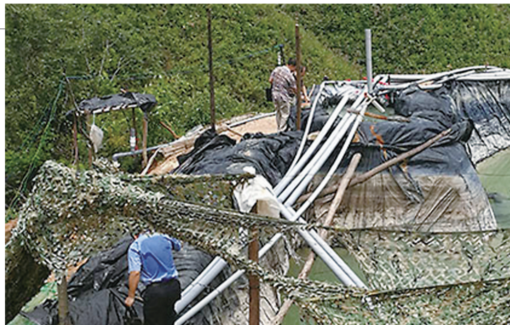
▲为躲避卫星监控，工地沉淀池周边拉起了许多迷彩布。图为检察官对现场进行调查