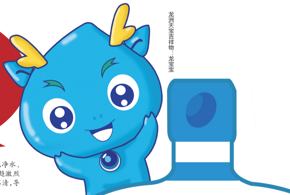
龙洲天宝吉祥物：龙宝宝