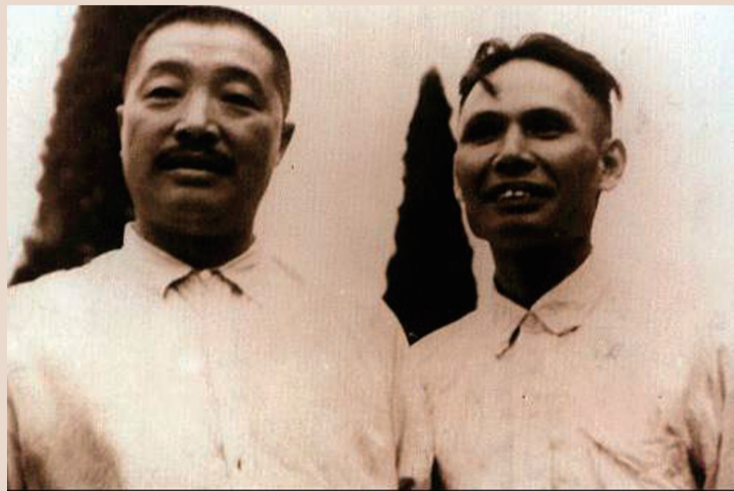
▲张子意(右)与贺龙合影