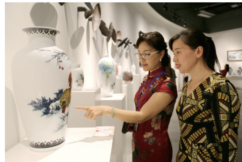
▲展览吸引了全国各地的数百位陶艺家观展交流