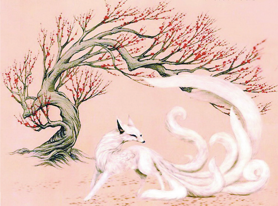
▲《山海经》中的九尾白狐形象

1、系统升级期间,暂停中国电信湖南公司客户所有的业务查询、充值缴费、停机及相应的提醒服务,客户通过第三方平台充值(含微信钱包、支付宝等)也将暂停到账及实时复机服务。 2、系统升级期间,暂停中国电信湖南公司业务受理的实时开通服务(只提供业务预受理),相关业务开通、上门安装均延迟到升级完成。 3、系统升级期间,暂停增值业务的订购。如需要帮助,请您拨打10000。由此给您造成的不便,敬请谅解。 中国电信股份有限公司湖南分公司 2018年5月14日