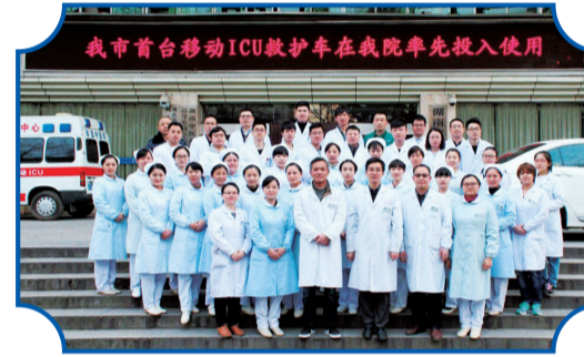
座多达一百多场,每年累积培训人数两千余人次,圆满完成全市一百多次医疗保障任务,达到了很好的社会效益与反响。

科室曾荣获湖南省劳动竞赛先进班组,参加“湖南省卫生应急技能竞赛”荣获团体第四名、个人三等奖。参加“健康株洲”急救知识竞赛荣获理论第一名抢答第二名、株洲市卫计委院前急救(11家急救站)年终考核连续三年第一名。2016年和2017年被评为株洲市优秀护理团队。2018年5月被湖南省卫计委评为“优质护理服务突出的科室”。科室启动的以“生命的呼唤”为主题的公益讲