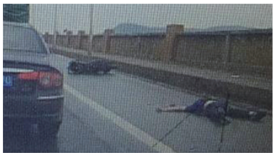
▲男子被甩出6米远,不幸身亡

“安全头盔是摩托车司乘人员生命的最后防线,通过我们近年来的宣传教育和集中整治,司乘人员佩戴安全头盔的安全意识提高了不少,但还是有不少人拿生命当儿戏。”龙逢春说,希望广大摩托车司乘人员都能佩戴符合标准的安全头盔,否则将被处以驾驶证记2分、罚款50元的处罚。