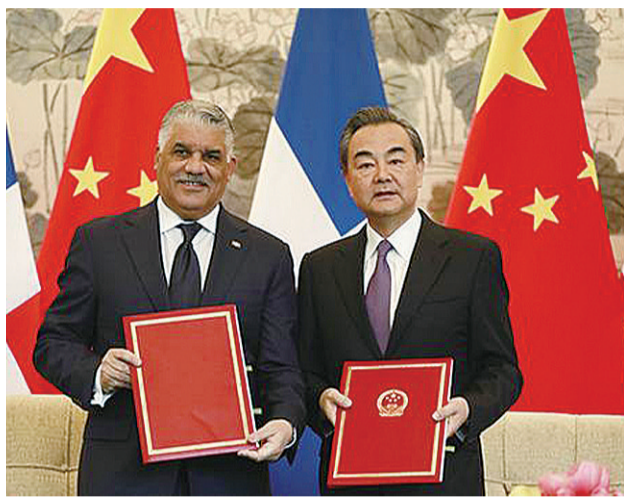
▲5月1日,中国国务委员兼外交部长王毅在北京与多米尼加外长巴尔加斯签署《中华人民共和国和多米尼加共和国关于建立外交关系的联合公报》(资料图)

这并非株洲企业首次同多米尼加有经贸往来。阳东电瓷相关负责人介绍,大概三年前,他们与多米尼加当地企业就已经有合作关系,“虽然货值一直不多,但比较稳定。”该负责人认为,两国建交,势必会带来贸易利好,今后或许将更多地开拓与当地企业合作。