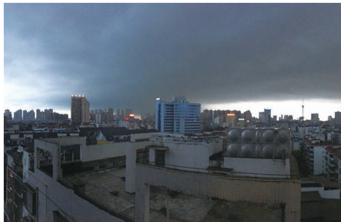
▲昨天傍晚,乌云压顶,暴雨将至

如果每个人都能在背包里放一本书,我相信,所有人的生活会更美好。 ——加西亚·马尔克斯