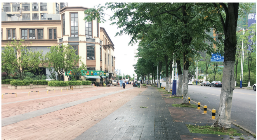
▲栾树下的路面黑乎乎的

昨日,市民谢先生拨打晚报新闻热线28829110反映:我在佳兆业路边的店铺上班,将车子停在前坪,但近一个月树上总是滴油到车上,洗都洗不掉。不知道树上为什么会滴油?