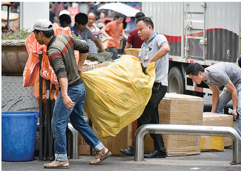
▲在芦淞市场群,快递员忙于拖运快递包裹

株洲一家民营快递企业负责人则认为,《条例》实施难,一大问题是它会增加快递企业的成本。