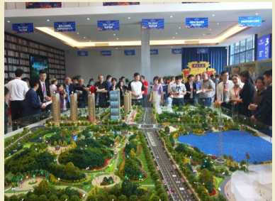
▲营销中心内,围满了看房的市民