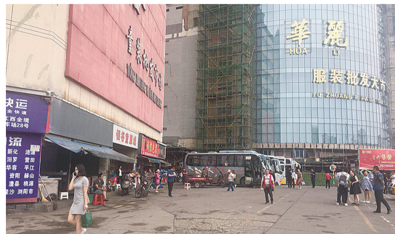
▲以往忙乱的停车场,现在秩序井然

本报讯(记者 戴凛 通讯员 郭力嘉)本月初,华丽停车场内省际、市际客运班线实行分流,进入汽车中心站、汽车南站、长途汽车站停靠和始发。昨日,交通部门对华丽停车场进行督查,现场未发现违规车辆。