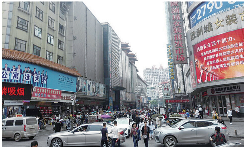
▲芦淞服饰市场群内车水马龙。一些乱停乱闯的小车、摩托车、三轮车导致现场交通混乱,影响正常通行