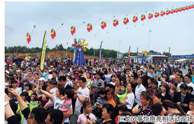
巨龙风筝惊艳亮相活动现场

都说春天是最好的时光，春风摇曳、繁华尽染，这个季节带上家人一起放飞风筝是再好不过了。2018年4月29日，万丰湖潍坊风筝艺术节在株洲万丰湖公园精彩开幕。国际风筝大师、非物质文化遗产传承人和风筝爱好者们齐聚万丰湖，上百人将心爱的风筝放飞天空，让梦想与风筝一起逆风飞翔！