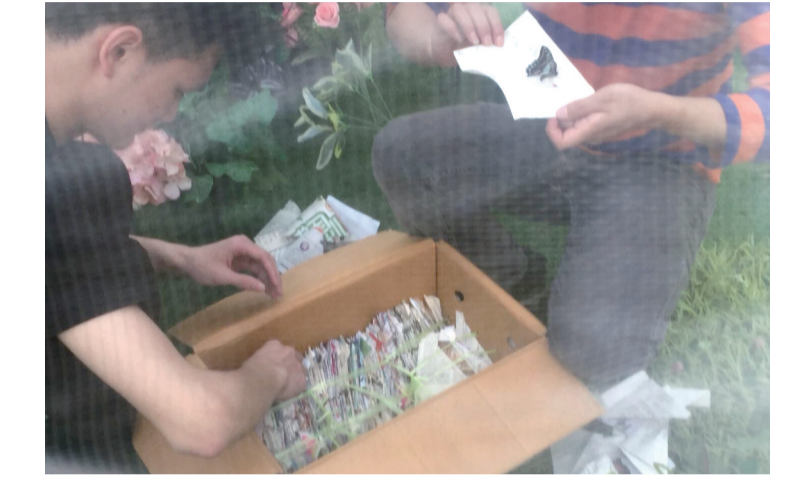
▲4月29日上午，工作人员在准备放飞蝴蝶

近日，天元区恒大华府举办的“珍稀蝴蝶展”遭到众多环保志愿者质疑。有环保志愿者称，“珍稀蝴蝶展”是对生态环境的破坏。目前该蝴蝶展已经被市林业局叫停。