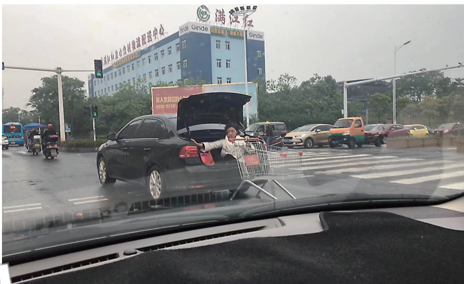
▲白衣女子坐在后备箱，还牵着一辆购物车

目前，“雷锋车队”正与市中心医院协商，有望在院内专门安排两个车位，供值班出租车停放。医生可根据具体情况安排乘车人员，为最需要的人群提供服务。(记者 成姣兰)