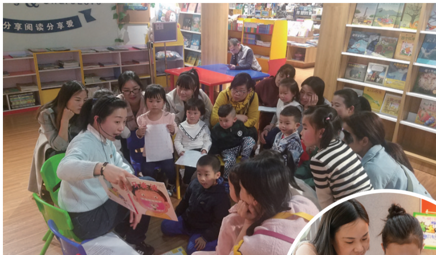
▲方唯书店每周日都有绘本故事阅读活动