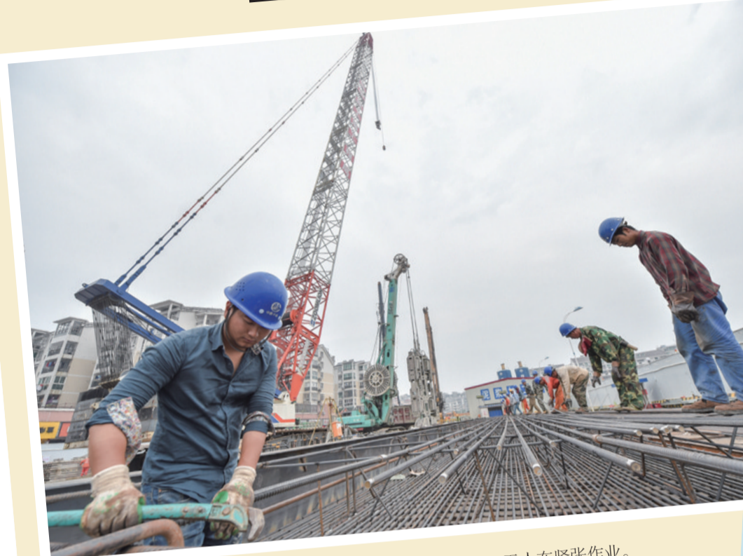
4月29日,在中铁上海局福州地铁五号线金山站施工现场,工人在紧张作业。当日是“五一”小长假第一天,在福建省福州市,福州地铁五号线正紧张施工,工地上热火朝天,一派繁忙的景象。