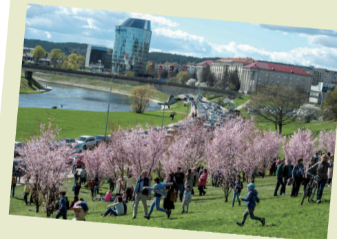
4月22日,人们在立陶宛首都维尔纽斯一个樱花盛开的公园里赏花。立陶宛近日天气逐渐转暖,首都维尔纽斯樱花盛开。