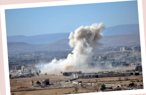
4月24日,在叙利亚大马士革南部,浓烟从极端组织“伊斯兰国”据点升起。叙政府军在大马士革南部打击“伊斯兰国”的军事行动持续推进,目标是将这一极端组织从该地区完全清除。