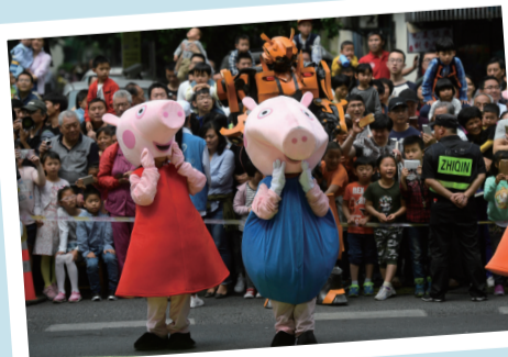
4月29日,扮演成“小猪佩奇”的演员在巡游队伍中表演。当日,第十四届中国国际动漫节彩车巡游活动在浙江杭州南宋御街中北创意街区举行。