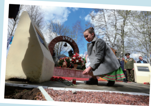
4月26日,在白俄罗斯斯拉夫哥罗德市,一名女孩在切尔诺贝利核事故纪念碑前献花。当日,白俄罗斯东部城市斯拉夫哥罗德举行集会,纪念切尔诺贝利核事故32周年。1986年4月26日,位于乌克兰北部靠近白俄罗斯边境的苏联切尔诺贝利核电站4号机组突然发生爆炸,造成30人当场死亡,逾吨强辐射物泄漏。这起核泄漏事故还使核电站周围6万多平方公里土地受到直接污染,320多万人受到核辐射侵害,成为迄今人类和平利用核能史上最严重的事故。