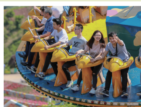
4月29日,游客在重庆涪陵区红酒小镇游玩。当日是“五一”小长假第一天,人们以各种方式放松心情,欢度假期。