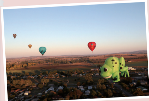
4月27日,在澳大利亚卡南德拉,热气球选手们在清晨试飞。南半球深秋时节,素有“热气球之都”美誉的澳洲东部小镇卡南德拉迎来一年一度的国际热气球挑战赛。