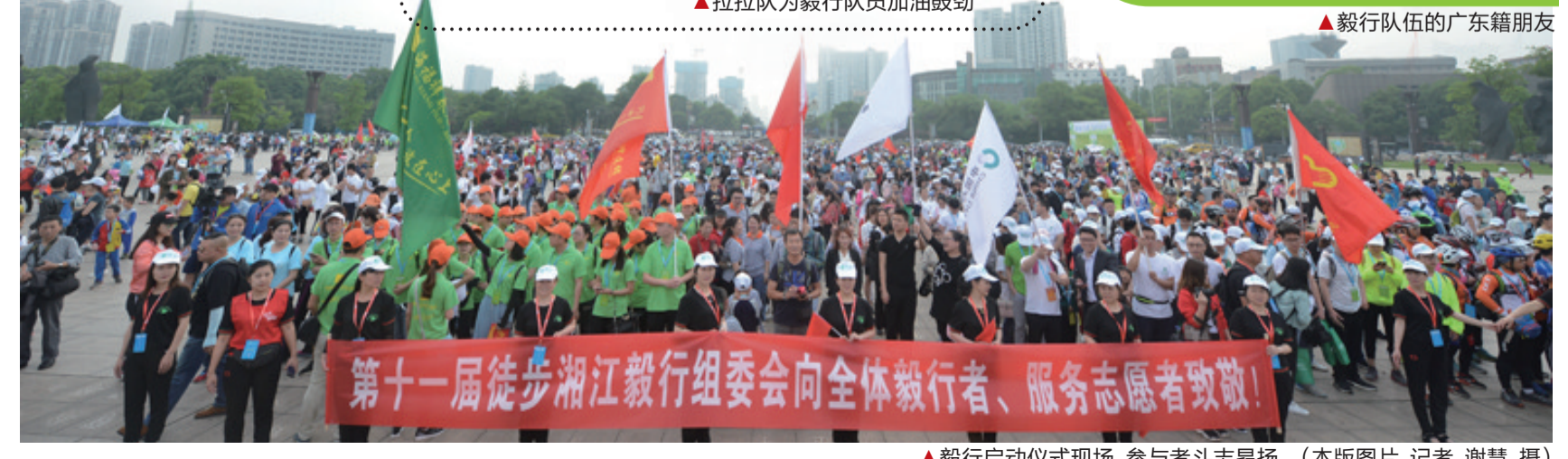
▲毅行启动仪式现场,参与者斗志昂扬