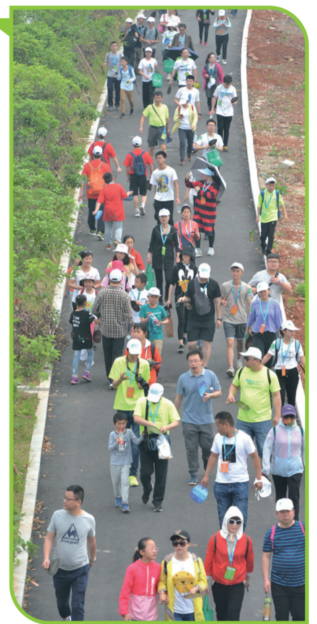
▲毅行队伍成了湘江边的一道美丽风景

因公益携手,本届徒步湘江环保毅行由株洲市文明办、株洲日报社主办,株洲晚报义工联合会执行承办,由株洲县第五中学、株洲市湘江集团协办,由中国人寿保险股份有限公司株洲分公司主赞助。活动还得到了湖南锦波食品、华晨神农湾、株洲三马名车等多家爱心企业,市中心医院等多家医院,市城管局等多家单位,湖南文明网等多家媒体的大力支持。