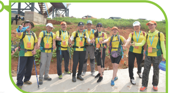
▲毅行队伍的广东籍朋友