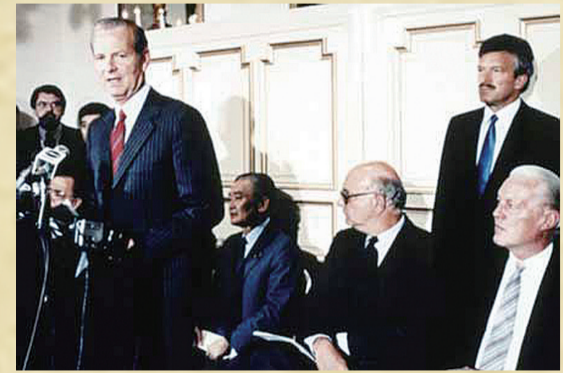
▲很多人以为广场协议毁灭了日本经济,实际上日本人在他们擅长的领域里,依旧如鱼得水

近日,中兴因为违反条约被美国制裁,也拖累了国内的相关产品研究进度。不少国人面对中美如天地般遥远的技术差距,果断成了“跪族”,认为中国不可能获胜。但是,在这里笔者要说一句,别绝望得太早了,上个世纪的日本作为美国的“儿子”,顶着制裁,照样取得了研发战争的胜利。