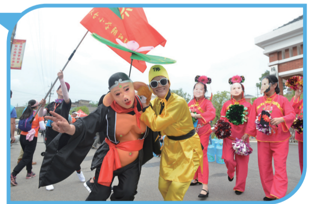
▲拉拉队为毅行队员加油鼓劲