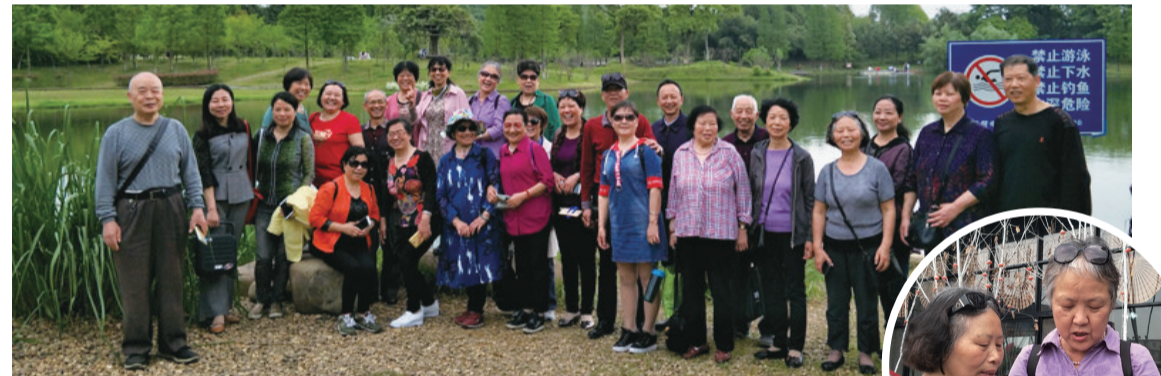
▲俱乐部会员游园大合影 ▶两个老同学54年再重逢

4月21日,株洲晚报夕阳红俱乐部组织了一次“踏春游园看戏剧”活动,30余名会员参加了此次活动。活动内容包括去长沙园林生态园踏春、参观湖南博物馆、观赏历史舞台剧《大汉伊人》等,时间为一天,活动深受会员喜爱。