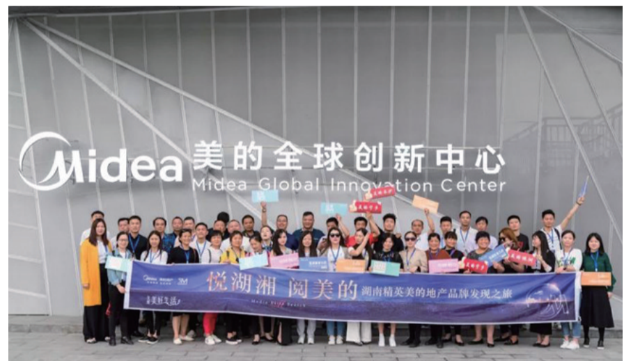
▲湖南精英美的地产品牌发现之旅

筑,在射击场亲身体验真实的乐趣,在夕阳西下中欣赏湖中飞鸟舞动,互相交流一天的品鉴感受。随着夜幕降临,美的地产为精英团提供了独一无二的半山秋泉高氧SPA,在此放松身心,结束了一天的旅程。第二天,精英团一起童心不减,一会儿穿越梦幻的童话世界,一会儿又开启了一场惊悚尖叫的探险之旅。