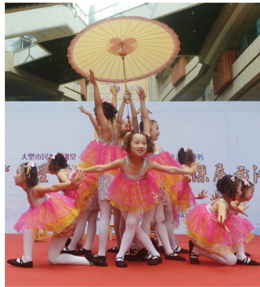
▲孩子们在进行才艺展演

本报讯(记者 戴凇 通讯员 罗金鹏)声乐、器乐、舞蹈、绘画……这些都能免费学。日前,芦淞区举行2018年“民星学苑”展示活动。相关负责人介绍,今年将继续依托辖区内11家优秀艺术培训机构为市民开展免费培训。有兴趣的市民可拨打电话28580599进行咨询。