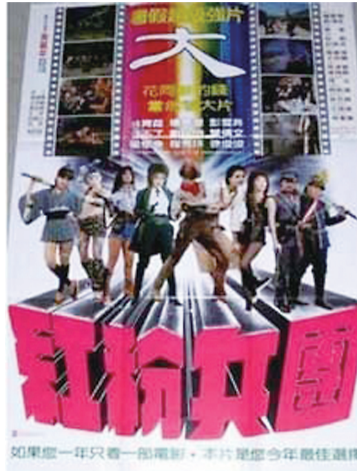
▲老杂志中的《红粉兵团》海报

也正因为此,抗战神剧们从不畏惧一二线城市青壮年网民的冷嘲热讽。享受吐槽快感的人,并不实际拥有遥控器投票权。真正应该有所警惕的,倒是那些有志于进入影院与进口大片一较票房高下的国产历史类电影。对于这些导演而言,想要拍好一部历史战争电影,并不是一件容易的事。