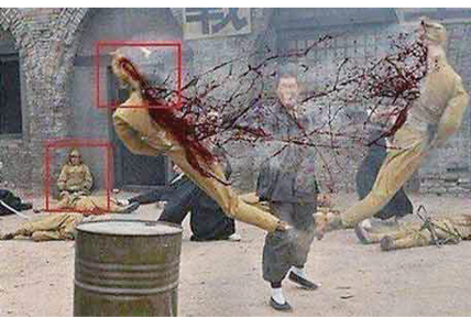
▲如今“手撕鬼子”已经成了抗战神剧的代名词

邻国人多少显得有些夸张的“认真严肃”态度,只能令国人汗颜不已。我们不禁要问,这些抗战神剧到底是如何拍摄出来的?