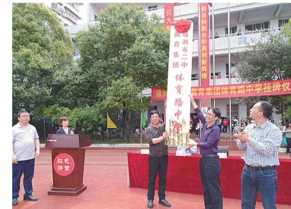
▲市二中教育集团体育路中学揭牌

本报讯(记者 姚时美)体育路中学在我市初中教育阶段的办学特色具有一定的影响力,市二中则是我市高中教育名校,顺应集团化办学趋势,两所学校成功结盟。前日上午,市二中教育集团