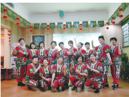
▲非洲鼓团队助阵楼盘踏春活动

4月22日下午,株洲晚报组织的首场楼盘踏春活动在云顶栖谷售楼部举行。尽管天公有些不作美,但看房者自发组织的非洲鼓表演、环保花朵手工DIY、小区内看房赏景等系列,让前来的市民意犹未尽。许多市民表示,还想跟着晚报的步伐一起去各个楼盘看好房。