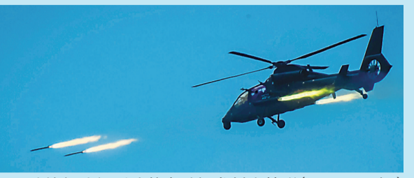
▲陆航部队新型武装直升机发射火箭弹(4月18日摄)

中国空军新闻发言人申进科19日发布消息，空军近日连续组织多架轰炸机、侦察机成体系“绕岛巡航”，锤炼提升维护国家主权和领土完整的能力。军事专家分析认为，此举表达了人民空军维护国家主权和领土完整的坚定决心和意志。