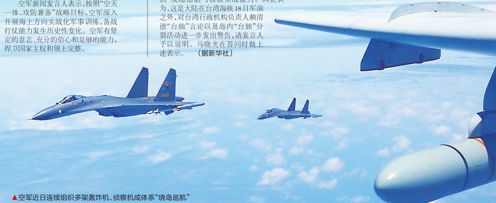
▲空军近日连续组织多架轰炸机、侦察机成体系“绕岛巡航”