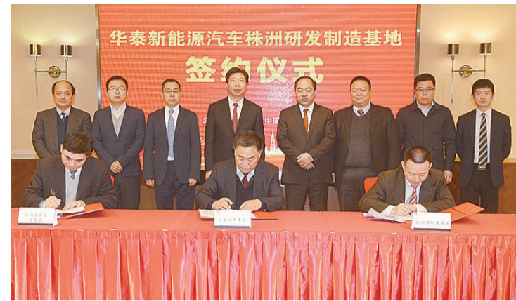
▲华泰新能源汽车株洲研发制造基地签约仪式

限公司在株洲投资4.4亿元设立的新公司,将建设年产60吨米镀膜金刚石产业化项目,该公司合作企业包括隆基股份、江苏协鑫、水晶光电、蓝思科技等全球知名光伏、蓝宝石加工企业。目前项目已开工,预计达产后年纳税7000万元,还可吸引相关制造企业向株洲聚拢。