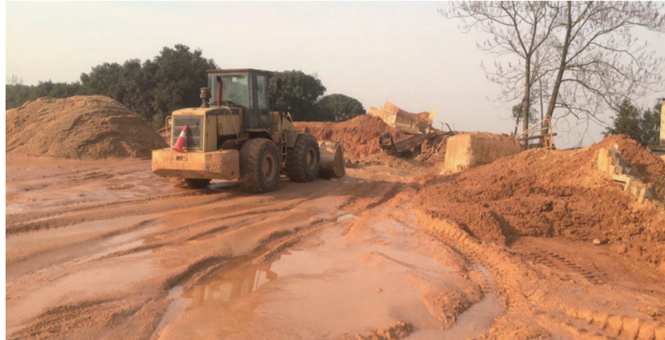
▲马家河一家砂石场,周边地面变成“黄泥地”

从山上取土,破坏了植被,洗砂过程中污染环境,大货车运输又压坏路面。“雨季马上要来了,接下来造成什么后果还不敢想象。”刘先生说,希望监管部门及时处理。