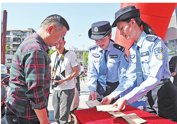
▲退赃大会现场

本报讯(记者 李卉 通讯员 刘肖翔 徐善海)昨日,荷塘公安分局举行退赃大会,现场向受害单位和群众退还了30.6万元现金、一辆汽车和16台摩托车等。其中,荷塘区某医院工作人员小王领回了单位遭窃的6.8万元,这也是退赃大会上金额最大的一笔。