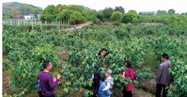
▲游客在园子采摘樱桃