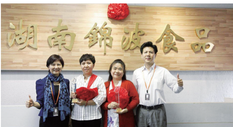
▲锦波公司董事长、总经理与锦波功臣合影

2018年4月11日,麦波蛋糕召开了评先评优会议,评选“锦波功臣”,感恩“功臣”们的付出,授予湖南锦波食品有限责任公司最高荣誉“锦波功臣”称号。为新一代年轻人做榜样,宣扬老一辈爱岗敬业、忠诚付出的良好品德。