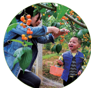
▲母子情深,其乐融融

离株洲城区10多公里的北部郊区,隐藏着—个占地近50亩的樱桃园,如今已硕果累累挂满枝头,将于4月21日(星期六)正式开园。