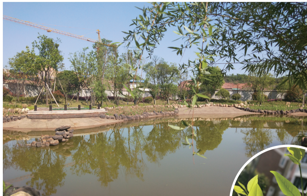
▲云顶栖谷小区内春意盎然