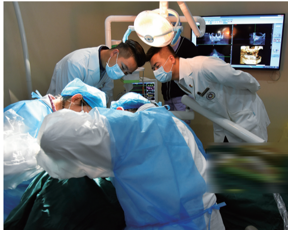
▲种植牙内购会,见证“一日得”种植牙手术现场