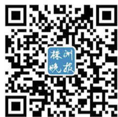
(扫一扫,关注株洲晚报房周刊)

由株洲晚报倾力打造的房产公益性平台——晚报房周刊购房俱乐部正式成立,为广大读者和市民提供房展会、置业咨询、参与活动、买房维权等多项服务,为购房者解决置业难题。如果你正在市面上寻找好房,想了解楼盘的施工进展,想参与晚报组织的各类活动,那么就加入晚报房周刊购房俱乐部吧!春暖花开,第一波活动楼盘踏春即将开启,可扫码加入并报名。