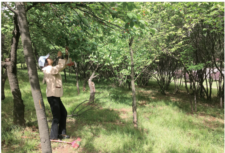
▲女子带着扫把掰折树枝，手中提着采摘的樱桃

昨日，市民网友“心蓝 caara”向株洲晚报微博反映，株洲大道沿线两棵枝繁叶茂、果实累累的樱桃树被人为破坏，希望相关部门对折断树木者追责。