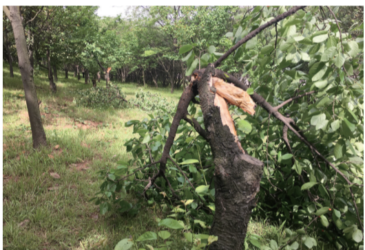
▲一株樱桃树已经拦腰折断