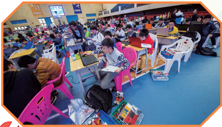
▲候场的选手们在准备比赛

据了解，我市自2014年起开展青少年机器人竞赛，目前已成功举办5届。5年来，我市越来越多的青少年和科技教师开始参与机器人竞赛活动，我市的机器人竞赛成绩也逐步提高。