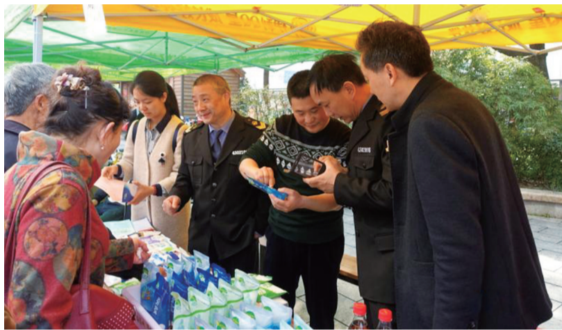
▲执法人员现场教市民辨别真假食盐

日前,株洲市食品药品安全委员会办公室,就有关食盐质量安全监管问题,解读《食盐专营办法》。