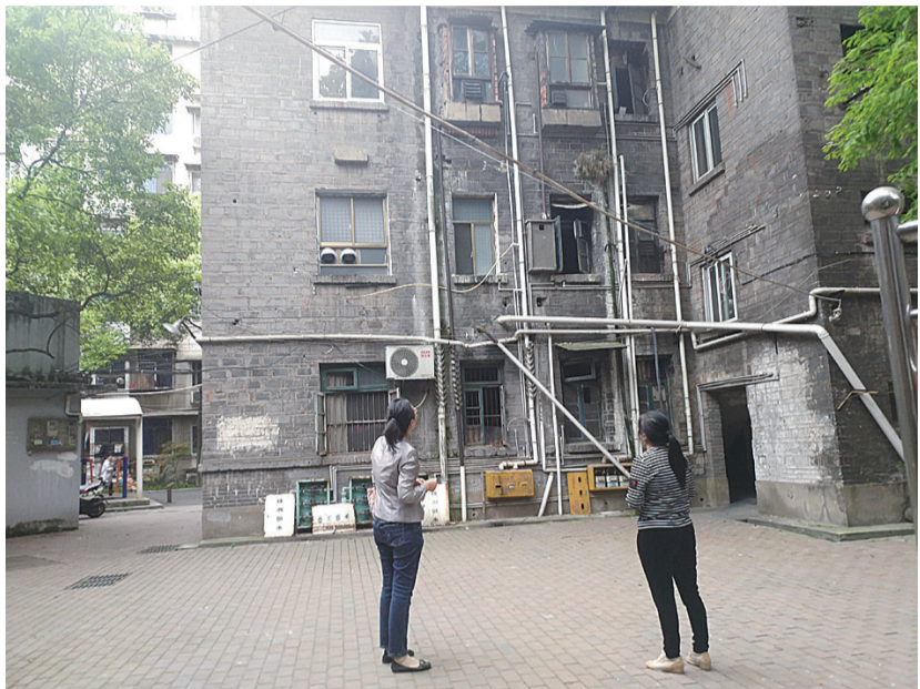
▲选矿生活区的老房子,外观很陈旧