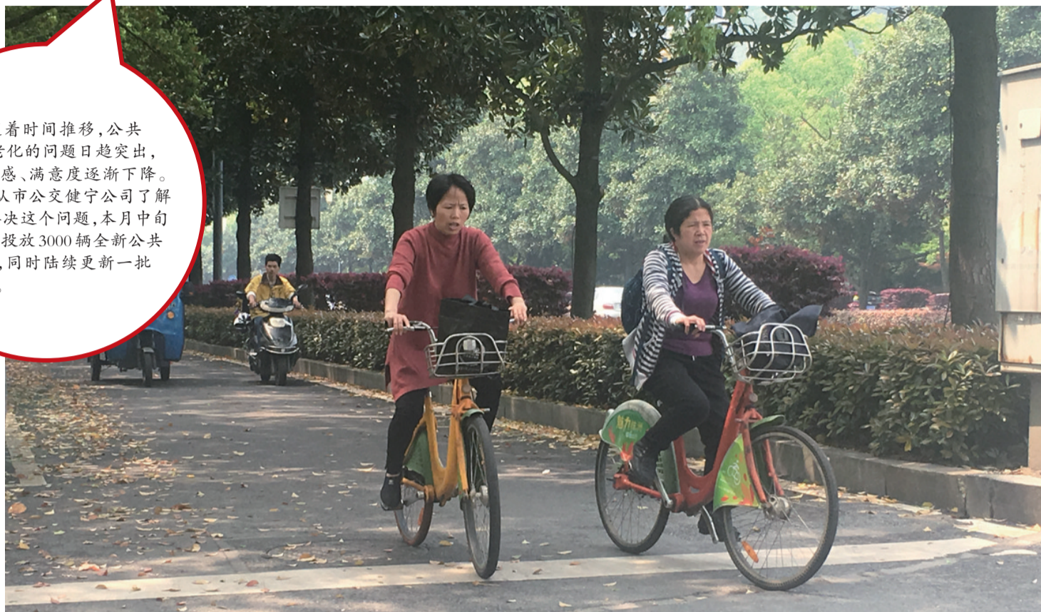
▲公共自行车是不少株洲人的出行选择

随着时间推移,公共自行车老化的问题日趋突出,市民体验感、满意度逐渐下降。记者昨日从市公交健宁公司了解到,为了解决这个问题,本月中旬该公司将投放3000辆全新公共自行车,同时陆续更新一批锁柱。