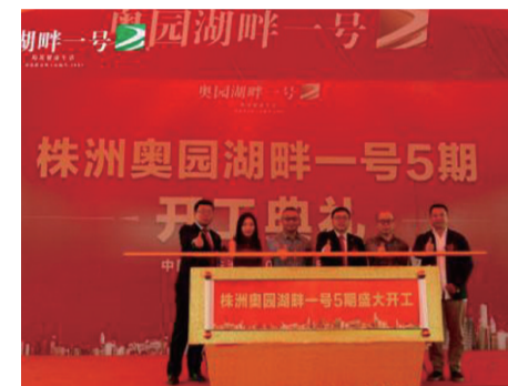
▲奥园湖畔一号盛大开工