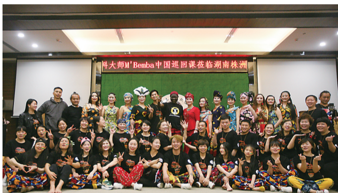
▲今年,班巴将在中国7个城市进行巡回授课,株洲是第一站

“更棒的是,你会进入到一个团队,大家互相磨合合作,个人英雄主义可能在此过程中变得毫无意义,因此你将不再感到自卑,更不会孤单,每一个成员的内心更加充盈,感受最持久的快乐。也许这才是我们传播与传承非洲鼓最大的意义。”非洲鼓老师贞子觉得,和其他艺术形式一样,非洲鼓能带给人心灵上的放松与快乐。