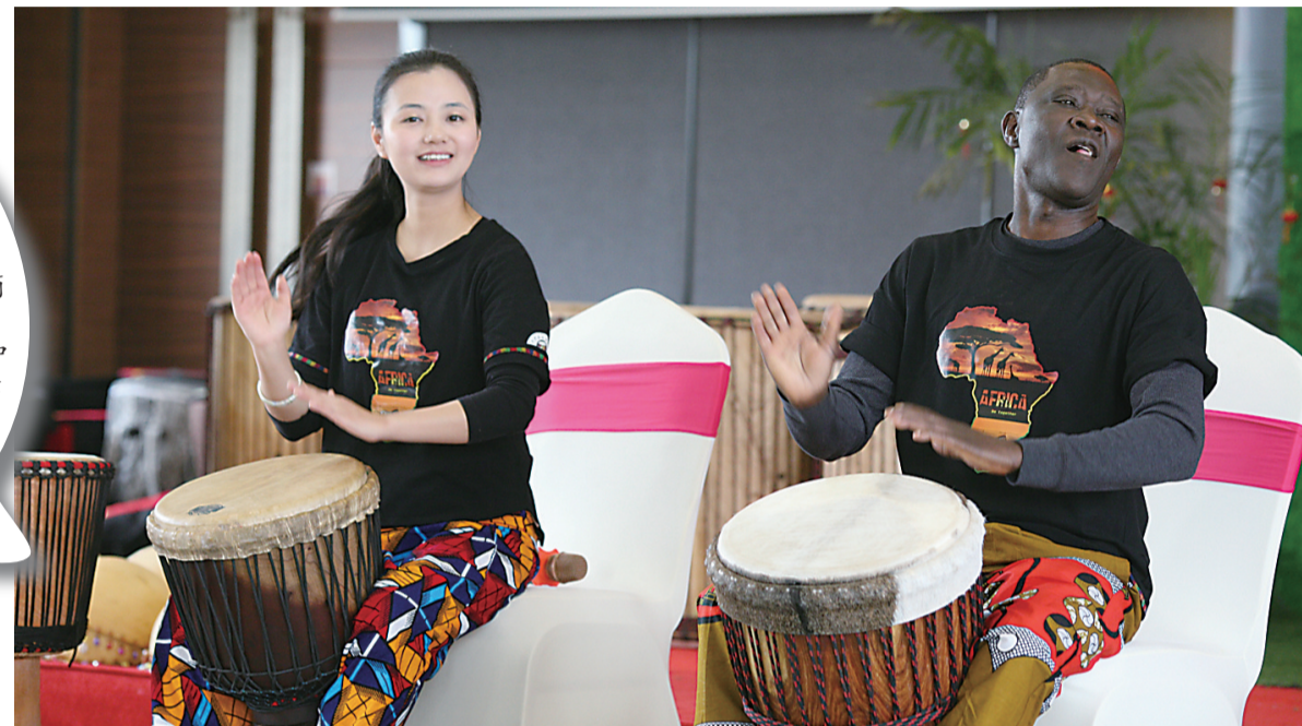
▲授课现场,班巴在演奏非洲鼓

“哒哒哒哒,嘟嘟嘟嘟嘟嘟……”周六下午的阳光很好,近60人身穿统一服装,围坐在酒店地毯上,变换双手敲打着面前的非洲鼓。他们目光所及,是一个黑人男子,穿着黑T恤、红色条纹裤子,用优美的旋律唱着几个简单的拟声词,间或用中文节拍“一二三四”。这是非洲鼓大师M'Bemba Bangoura(中文音译名为“班巴”)在株洲的授课现场。作为班巴今年在中国7个城市巡回授课的首站,株洲为何获得了班巴的青睐?哪些株洲人在打非洲鼓,他们从中获得了什么?