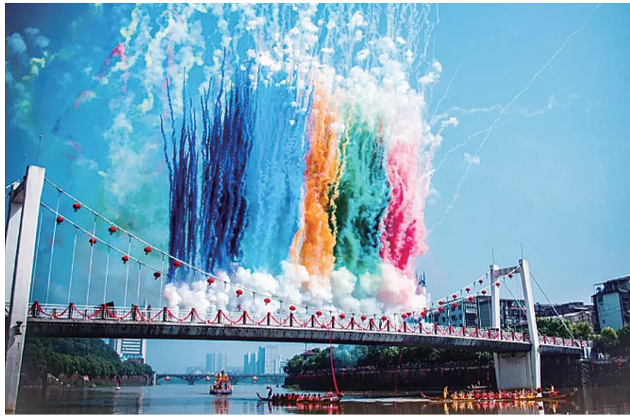
▲日景烟花燃放效果