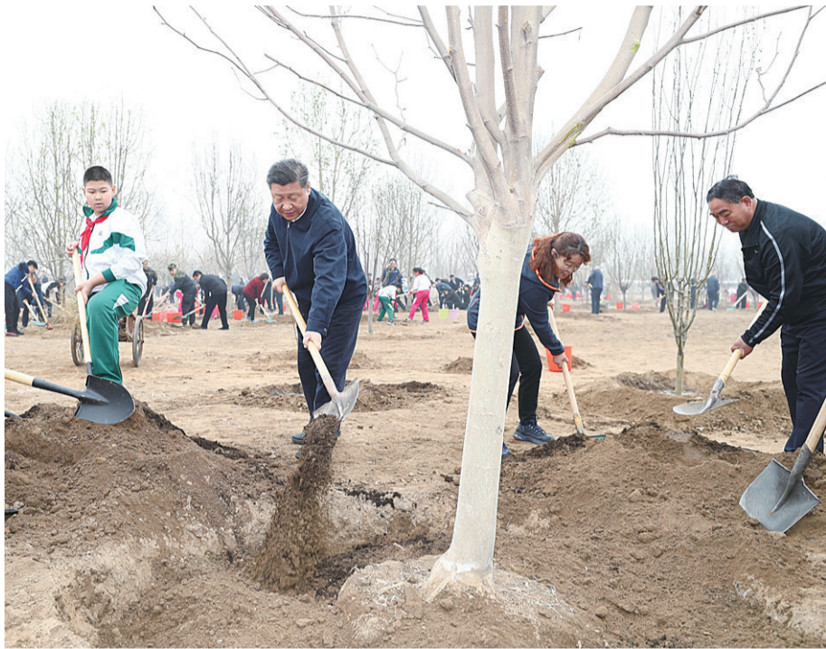
▲4月2日,党和国家领导人习近平、李克强、栗战书、汪洋、王沪宁、赵乐际、韩正、王岐山等来到北京市通州区张家湾镇参加首都义务植树活动。图为习近平同大家一起植树