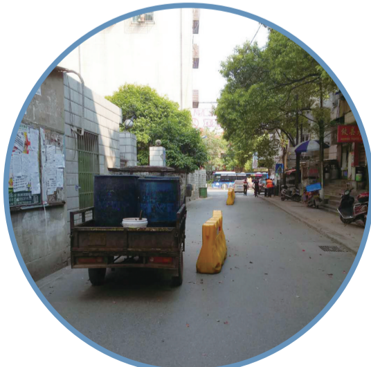
▲路中间摆放着黄色护栏

周毅说,他们将进一步了解情况,与物业公司协商,拿出妥善解决方案,尽量避免出现堵车的状况。