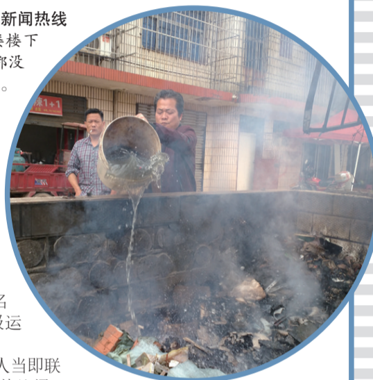
▲正在燃烧的垃圾堆 浓烟滚滚

社区负责人告诉记者,这一次是没有抓到证据,如果下次再发现类似情况,一经查实坚决辞退。