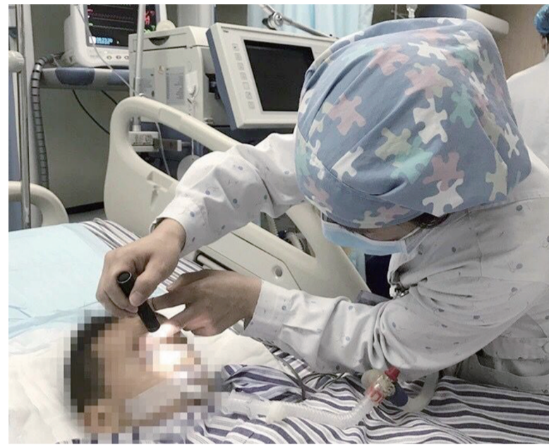
▲医生查看溺水男孩的生命体征

本报讯(记者 赵露 通讯员 王家明)近日,一名1岁半的男孩独自玩耍时不慎落水,家长发现时已无意识和呼吸。经医护人员积极抢救,孩子目前已转入ICU病房继续治疗,仍未脱离生命危险。