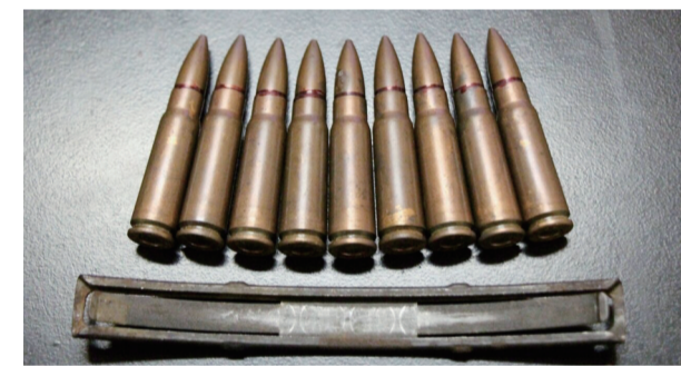
▲民警从文某行李箱中查获的子弹和弹夹

本报讯(记者 肖蓉 通讯员 谭湘琴)文某存留了9发步枪子弹,并放在行李箱里准备搭高铁,结果在株洲西站进站口被警方查获。