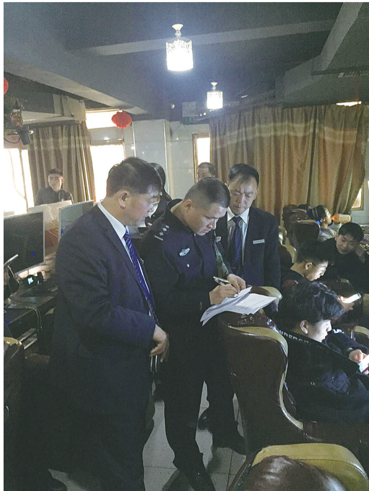
▲执法人员对涉事网吧进行查处

“这是近年来少有的从重处罚力度。”市文化市场综合执法局相关负责人告诉记者,近段时间,一些网吧老板为了获取利益,私自加装万象破解版系统,绕开正版万象系统,致使不需要刷身份证即可上网。这种俗称安装“双系统”的行为绕开了实名登记制度,致使接纳未成年人现象屡禁不止。