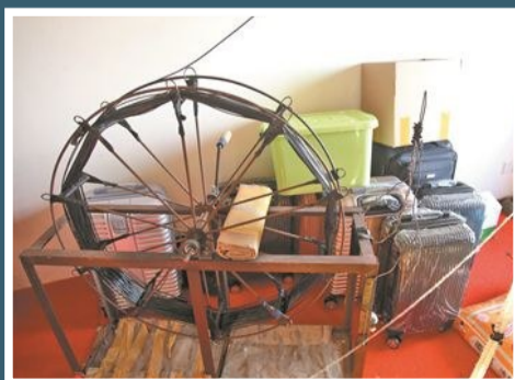
▲被查获的无人机、滑轮和绞盘