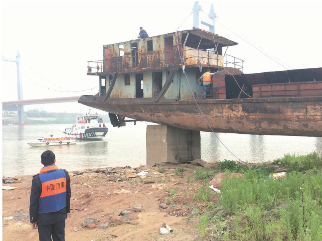
▲工作人员对“僵尸船”进行拆解

本报讯(记者 戴凛 通讯员 周蓉)“僵尸船”不仅会影响行洪,汛期还会威胁到桥梁安全。昨日,株洲地方海事局等部门对仍停靠在河道边的4条“僵尸船”进行强制切割拆解。