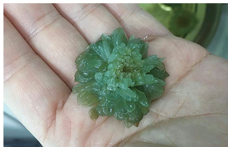
菊花泡茶后变绿了

本报讯(记者 肖蓉 通讯员 李菁菁) “菊花泡茶居然变成绿色了,有问题吗?”昨日,黄女士称,她近日在超市买了散装贡菊花茶。回家后,她用开水泡了5朵菊花。可是过了两个小时,她发现原本淡黄色的菊花变成了淡绿色。