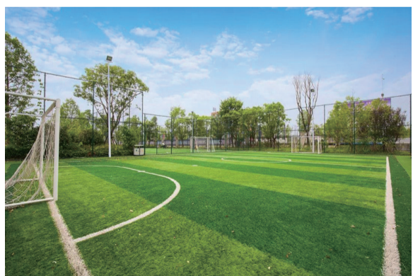
▲置信·逸都花园的运动公园