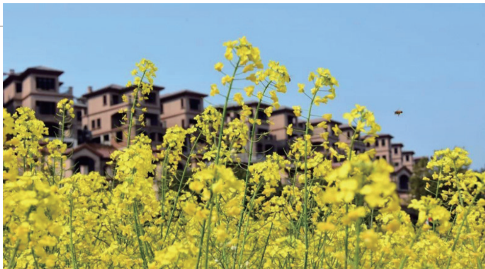
▲青龙湾油菜花海实景图