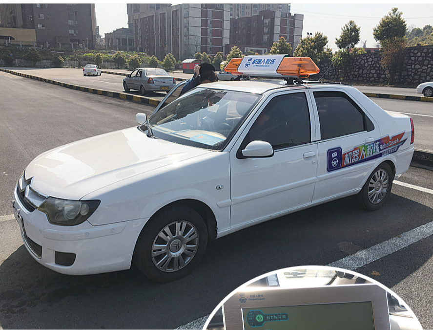
▲装有“机器人教练”的驾培车辆