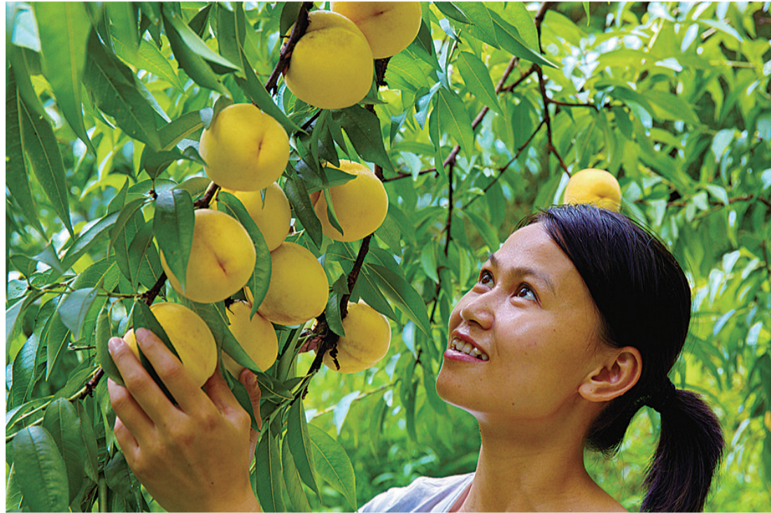
▲炎陵黄桃 资料图片

炎陵黄桃名气将更加响亮。近日,记者从中央电视台“国家品牌计划——广告精准扶贫”项目湖南推介产品发布会上获悉,炎陵黄桃等5个湖南地方农特产品成功入选免推荐项目,将登上CCTV一套、二套、三套、四套、七套、八套、九套、十三套等8个最有影响力频套的公益广告黄金时段,每天播出频次不低于20次。