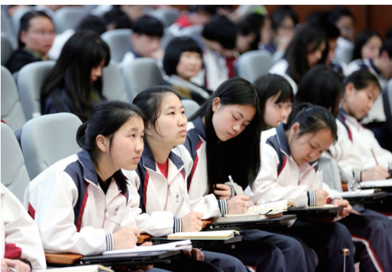
▲学生们聚精会神听讲