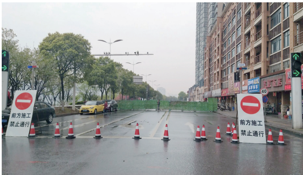
▲滨江南路天伦路口封闭施工

本报讯(记者 戴凜 通讯员 殷滋)因滨江路渡口排渍站路面下陷抢险工程施工,滨江南路天伦路口到湘银金色阳光小区路段已实行全封闭交通管制。受此影响,T42路公交车线路将临时调整。