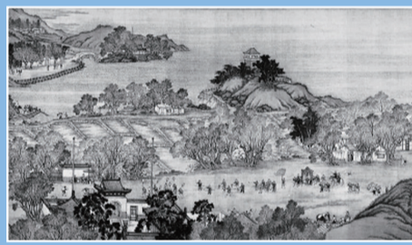
▲《清明上河图》中,路边有一片柳树,路上一顶轿子,内坐一妇人。轿上装饰着花朵,后边跟着骑马的、挑担的,他们正是从郊外踏青归来。