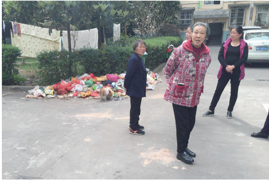
▲小区道路旁堆满了垃圾,气味难闻