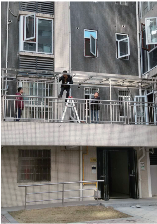
▲执法人员拆除违建的阳光房