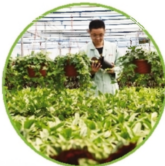
云田社区花卉培育大棚。

我是土生土长的株洲人,从美国留学回来,最终扎根于此,一方面是由于对家乡千里的热爱,另一方面是家乡越来越美好,前景越来越光明。有多少奋斗,就会有多少收获。我们身处农村,对美好生活也有很多向往,发展目标也越来越高。不忘初心,不辱故乡故土,我们新农村有举国爱戴“敢为天下先”的精神,用创造赢得未来,以兢兢业业的姿态走向理想的彼岸。