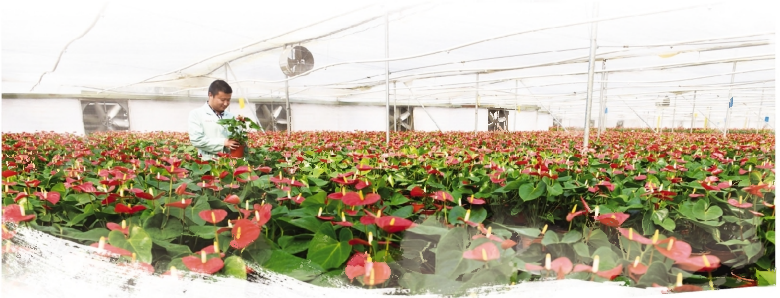
云田社区花卉培育大棚。