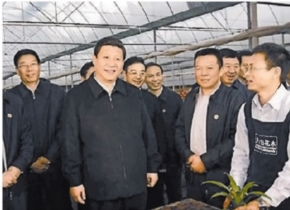
2011年3月21日,习近平在株洲市云田示范区云田社区花卉培育大棚,详细了解这里的花卉销售和农户收益。(新华社资料图片)

习近平高兴地说,这说明社会主义新农村建设很有奔头:“‘两型社会’不能光有现代城市、现代工业,还要有现代农业。没有农村的小康也就没有全面的小康。这条路你们已经走出来了,要坚定地走下去!”